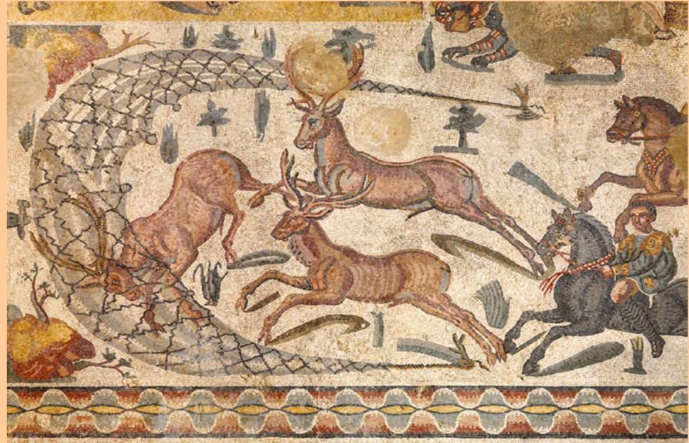
Piazza Armerina, prima metà IV sec. d.C. ('Piccola caccia') [sopra]

agricolae reserant iam tuta mapalia Mauri