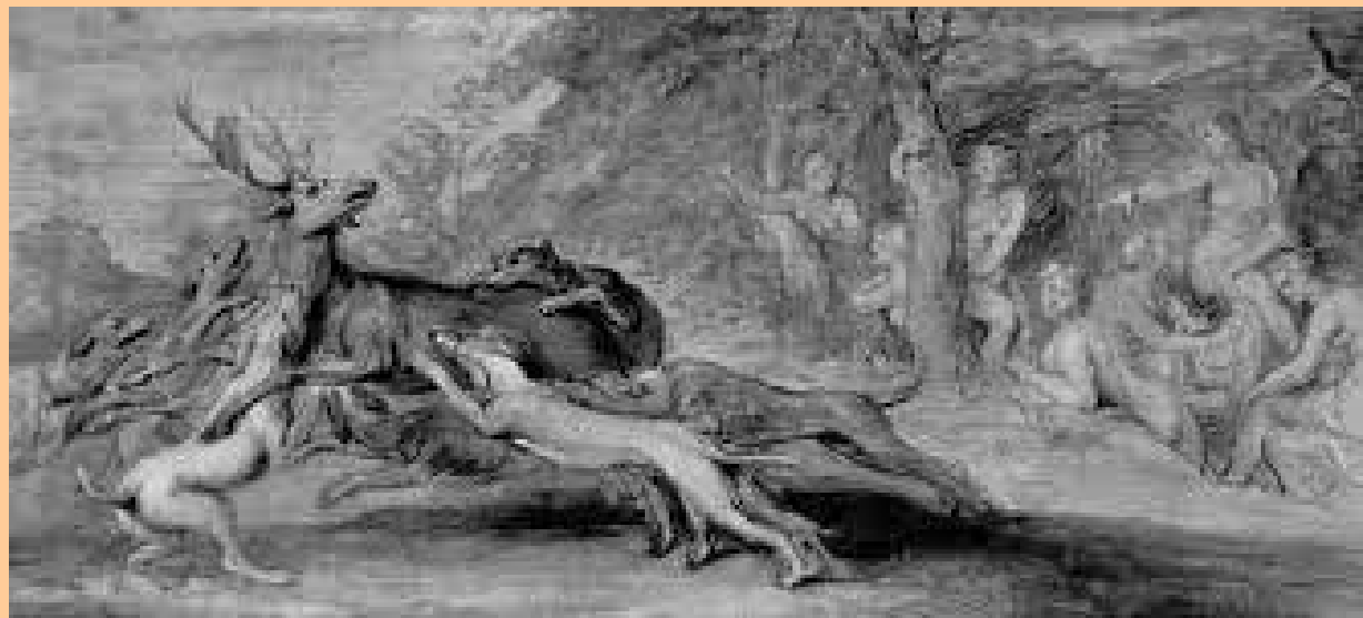
P. P. Rubens, Morte di Atteone , 1639 - già Nieuwenhuys Collection, Bruxelles (venduto nel 1985)