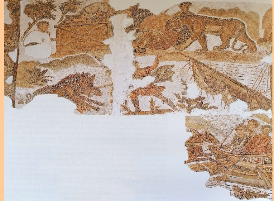
Cartagine, inizio IV sec. d.C.

[...] Ratibus pars ibat onustis per freta vel fluvios; exanguis dextera torpet remigis et propriam metuebat navita mercem.