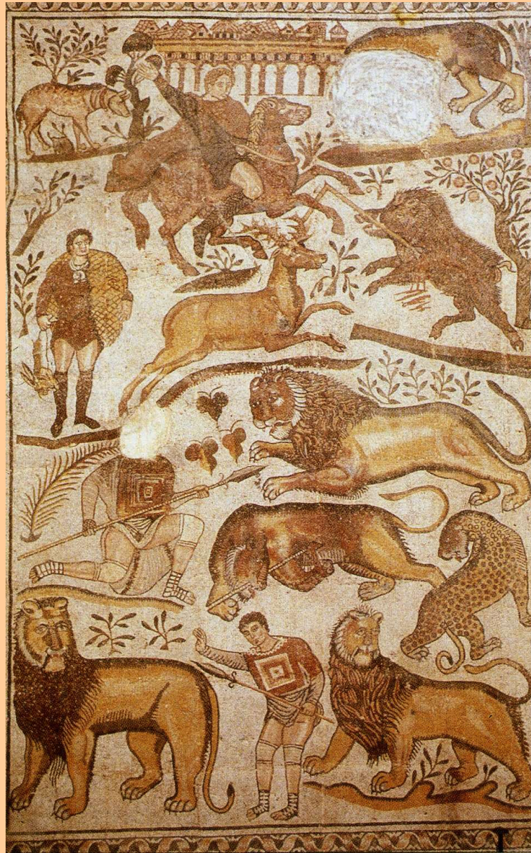
Cuicul, fine IV - inizio V sec. d.C.