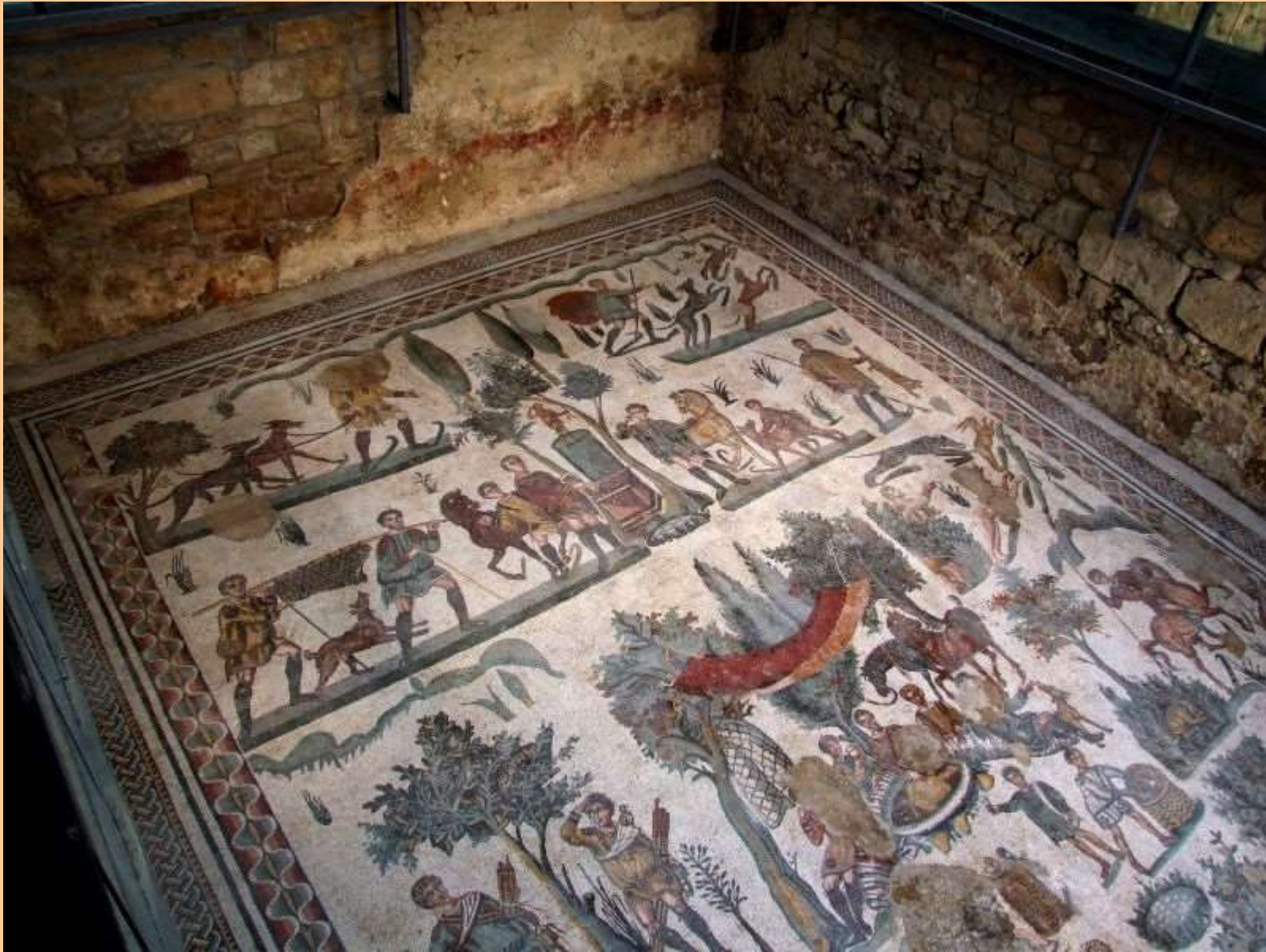
Piazza Armerina, I metà del IV sec. d.C. ('Piccola caccia')