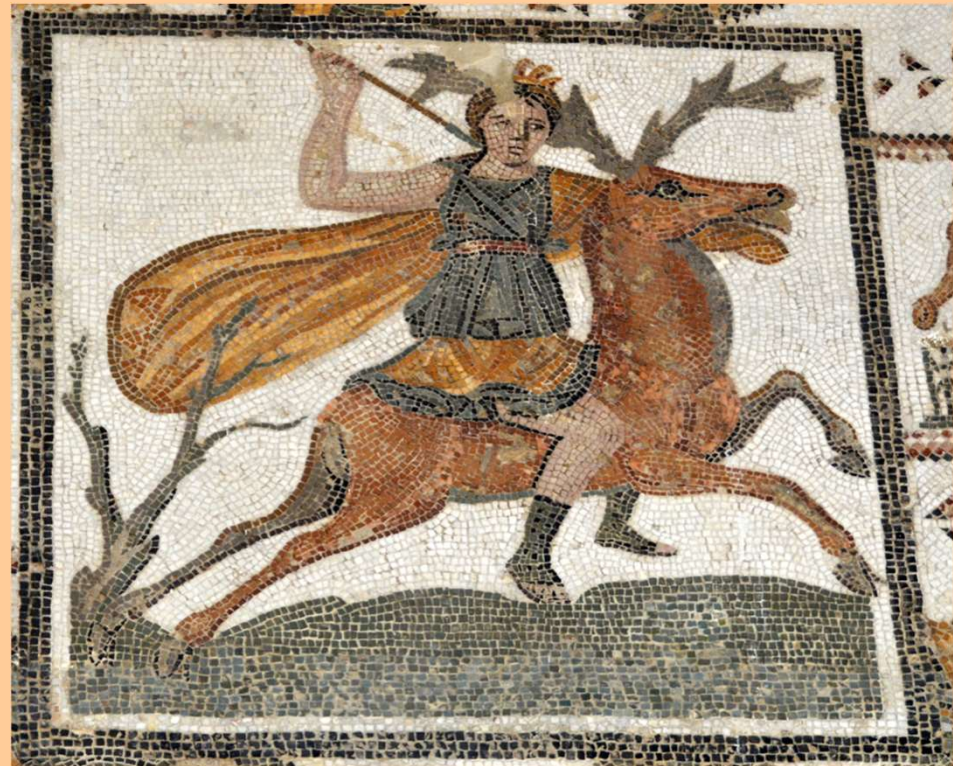
Thuburbo Maius, seconda metà III sec. d.C

Dixit et extemplo frondosa fertur ab Alpe 285 trans pelagus. Cervi currum subiere iugales, quos decus esse deae primi sub limine caeli roscida fecundis concepit Luna cavernis: par nitor intactis nivibus; frons discolor auro germinat et spatio summas aequantia fagos 290 cornua ramoso surgunt procera metallo.