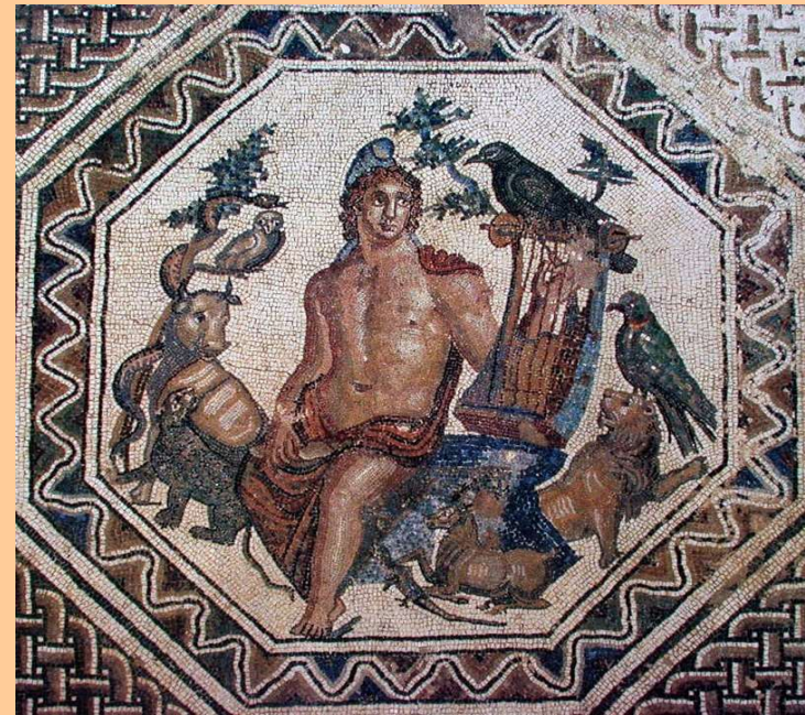
Turrus Libisonis, ca. 250-260 d.C.