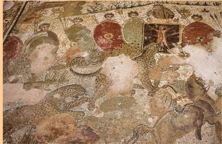
Piazza Armerina, prima metà del IV sec. d.C.