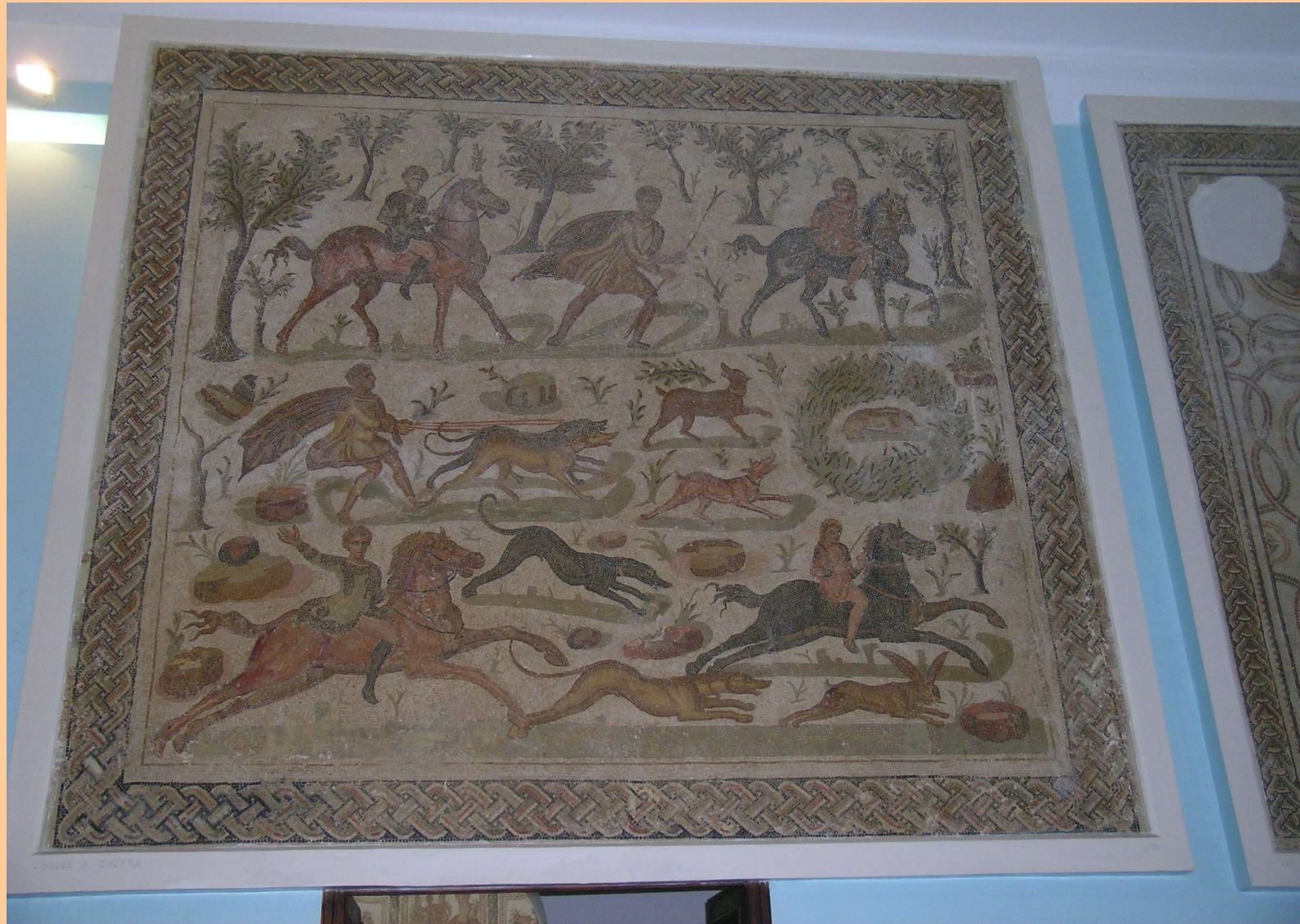
Thysdrus, metà III sec. d.C.