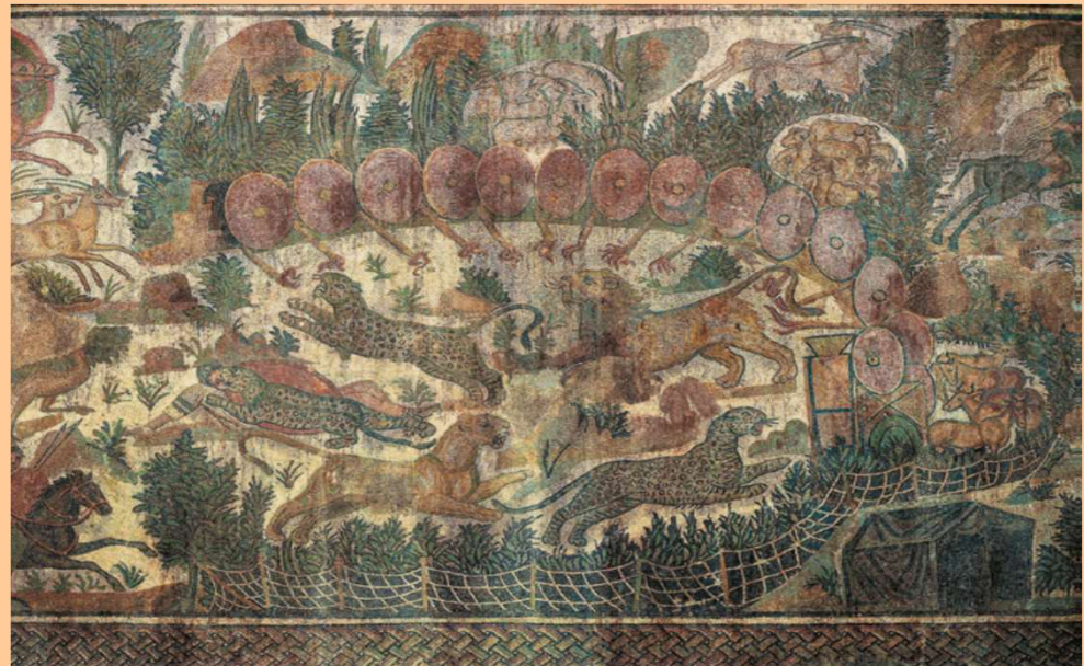
Hippo Regius, inizio del IV sec. d.C. [sotto]