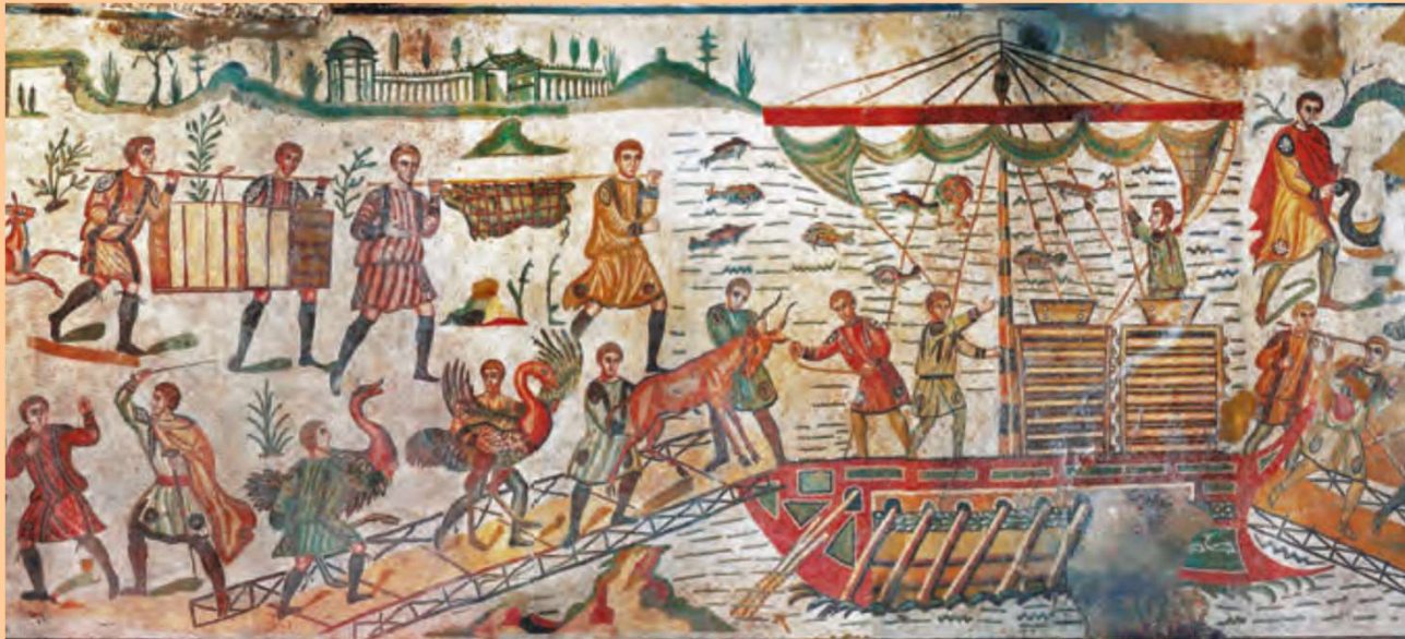
Piazza Armerina, prima metà del IV sec. d.C.