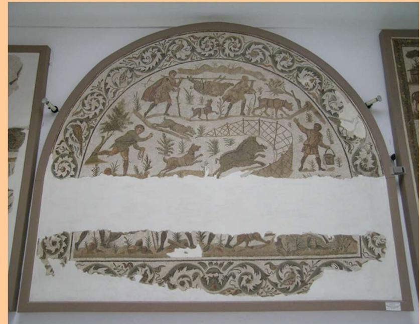
Cartagine, inizio IV sec. d.C.

magnaue taurorum fracturae colla Britannae.