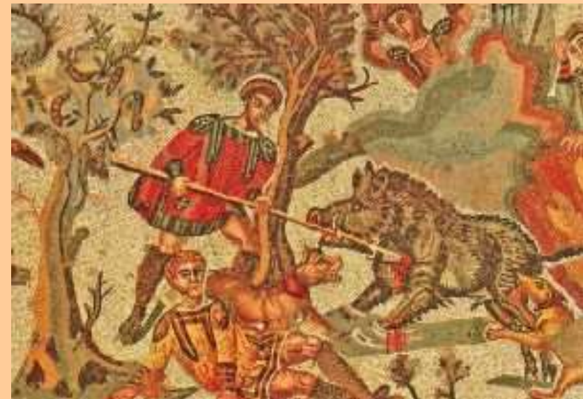
Piazza Armerina, I metà del IV sec. d.C. (Piccola caccia)