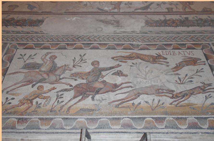
Uthina, fine III - inizio IV sec. d.C.