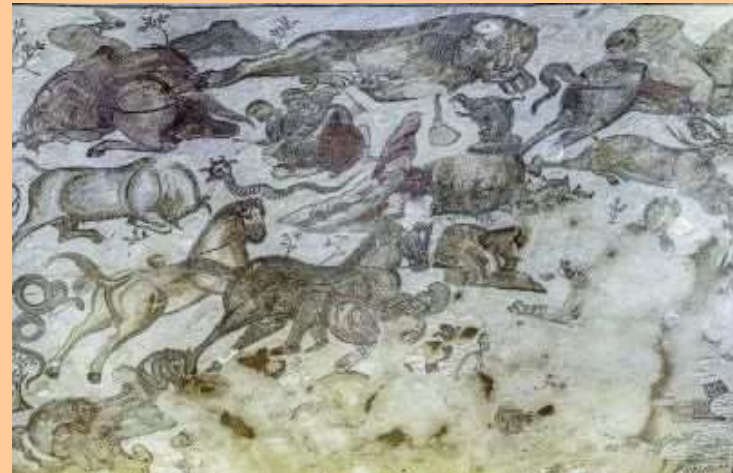
Piazza Armerina, nel triclinio trilobato aggiunto in età teodosiana. (Gli avversari di Ercole nelle dodici fatiche)