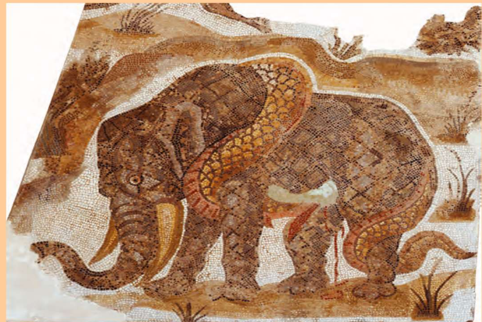
Dermech, inizio del IV sec. d.C.

Cfr. Stat. Achill. 123; Plin. paneg. 81, 1