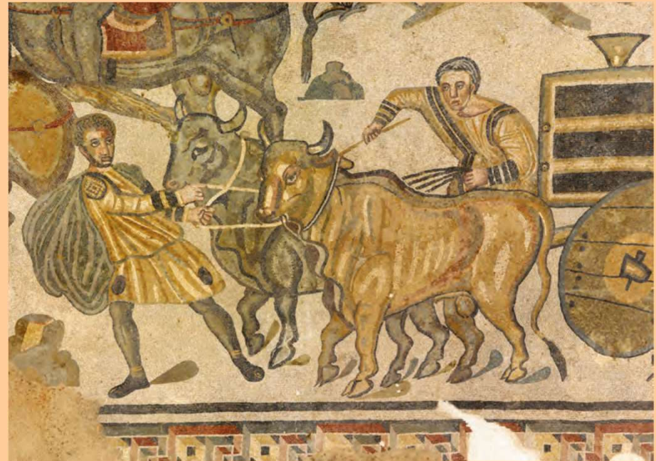
Piazza Armerina, prima metà del IV sec. d.C.