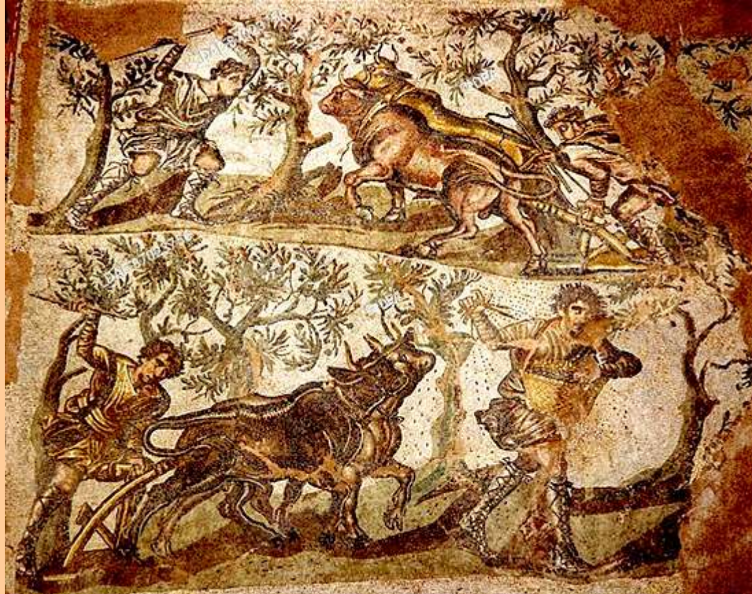
Cesarea di Mauritania, III sec. d.C.